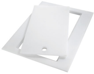
HPDE Twin 砧板 8644 101